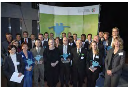
Impressionen von der ENTERPreisverleihung in der E.ON-Zentrale in Düsseldorf (Bild oben). Minister Armin Laschet (Bild Mitte) verleiht Ehrenpreise an gesellschaftlich engagierte Unternehmen (Bild unten).