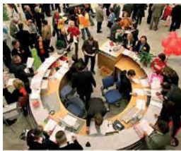
Bertelsmann Stiftung (Hrsg.) Grenzgänger, Pfadfinder, Arrangeure Mittlerorganisationen zwischen Unternehmen und Gemeinwohrgemeinschaften